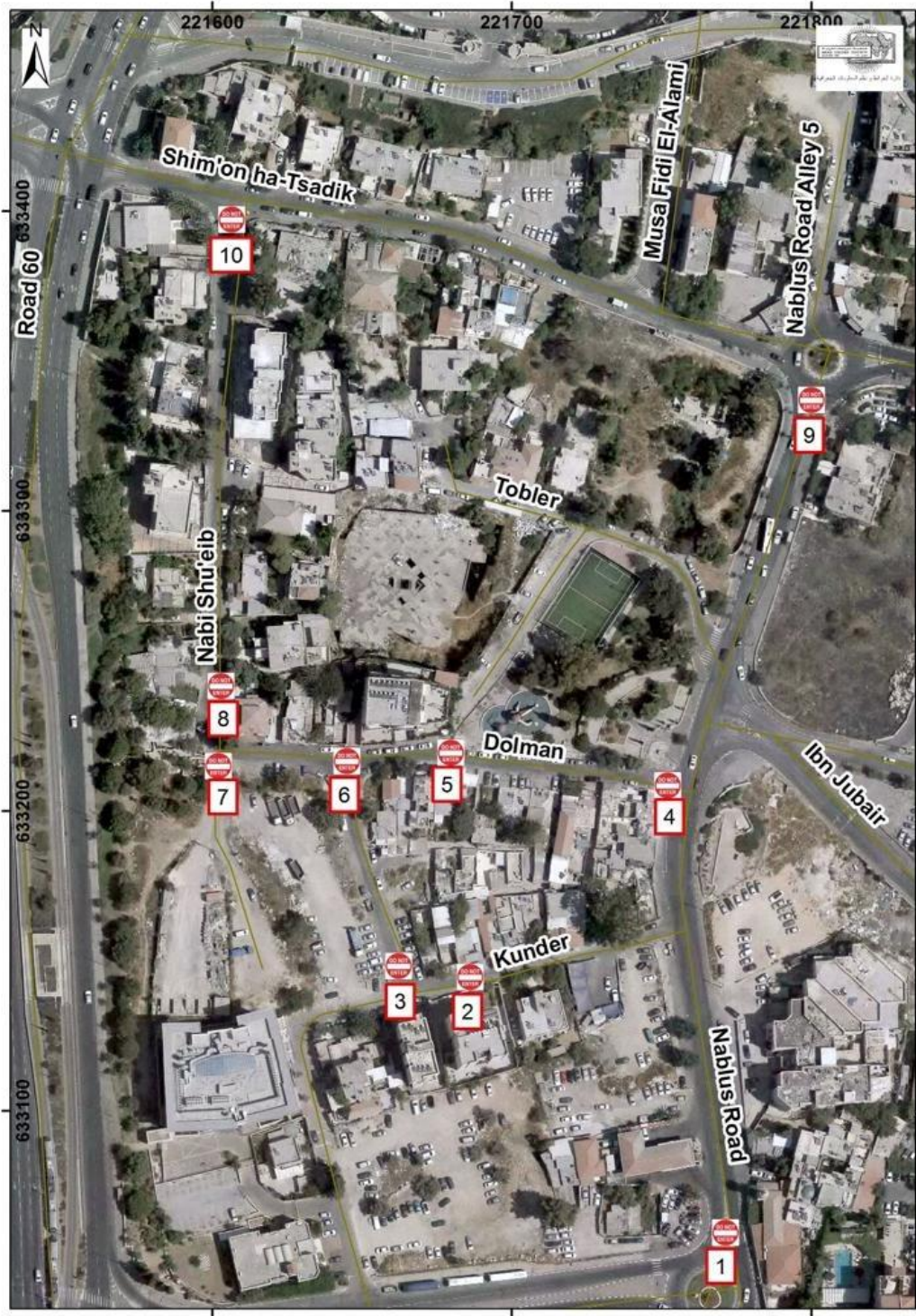
להלן מספר תמונות להמחשת המצב: